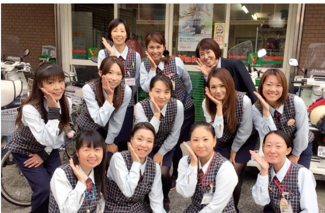
向ヶ丘センター:川崎市多摩区长尾3-6-5

川崎市多摩区(中野島、中野島1~6、登戸、登戸新町、菅稲田堤1~3、菅北浦1~3・5、菅馬場1~2、菅1~6、菅城下、菅野戸呂、菅仙石1、布田、生田1~3、和泉、枳形1~4)