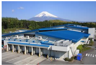
↑ 富士裾野工場 ↑