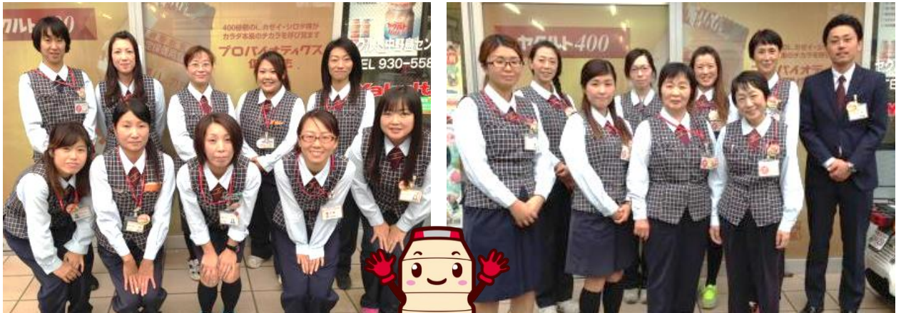
中野島センター:川崎市多摩区生田3-4-8